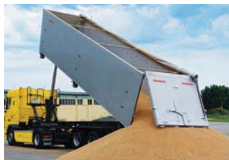
Kippsattelanhänger mit Alu-Großraummulde