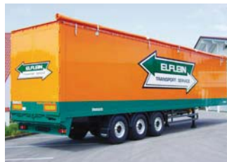
Schubboden-Sattelanhänger mit geschlossenen Seitenwänden