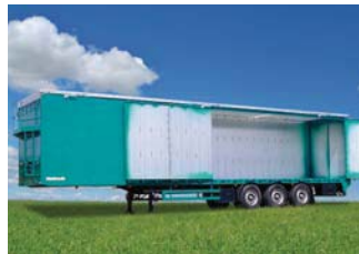
Schubboden-Sattelanhänger mit Seitentüren