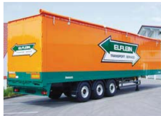
Schubboden-Sattelanhänger mit geschlossenen Seitenwänden